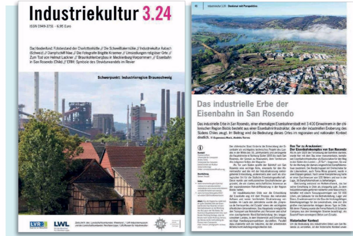
EL FACSIMIL CON LA PUBLICACIÓN en la revista alemana de divulgación científica IndustrieKultur sobre el patrimonio industrial de San Rosendo.

Desde mediados de 2024, cuando en el Diario Oficial se publicó la resolución del Ministerio de las Culturas, Artes y Patrimonio, el complejo ferroviario de San Rosendo tiene la categoría de monumento histórico nacional.