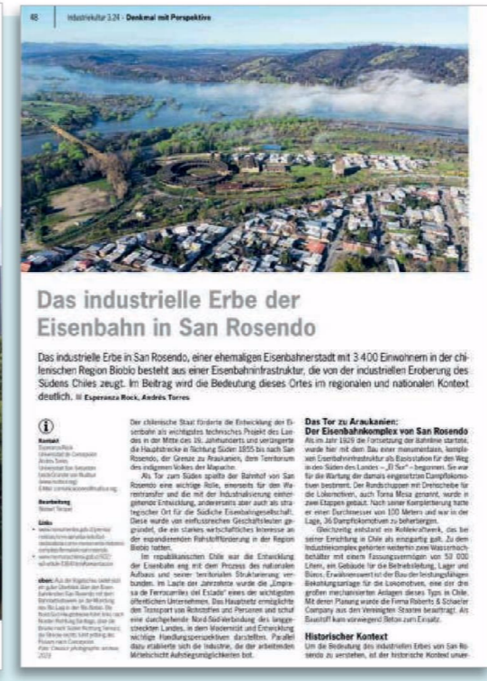
Facsimile of the magazine article 'Das industrielle Erbe der Eisenbahn in San Rosendo' with a landscape photo and text.

El complejo ferroviario data de 1929 cuando se inició la construcción de una serie de edificios industriales de características monumentales, destinados a la mantención de los trenes a vapor de la época. Más de 400 funcionarios llegaron a trabajar en la localidad en el periodo de mayor auge de ferrocarriles.