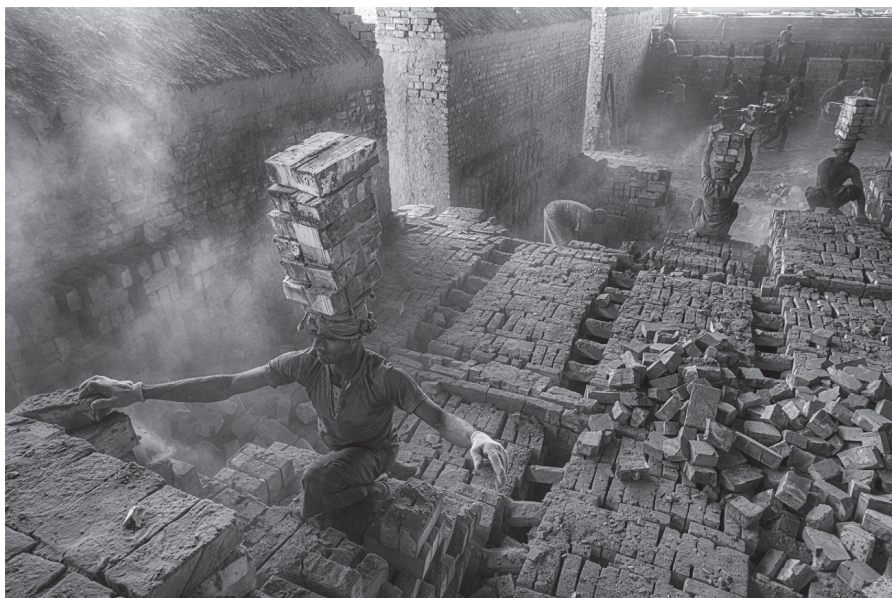
Primer Premio 2023: "Vida enladrillada" , de Arturo Lopez Illana