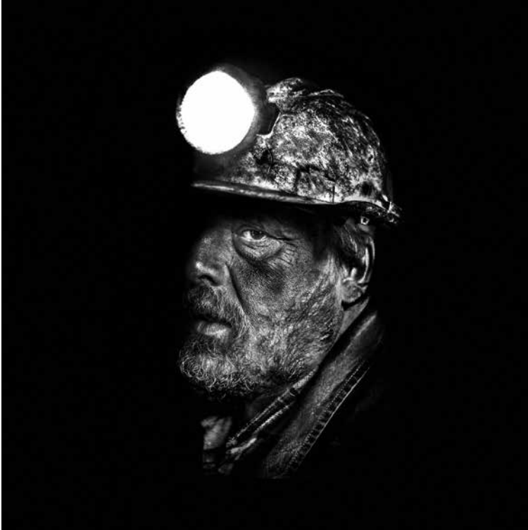
Primer Premio 2022: “Retrato de un minero en Asturias” , de Javier Arcenillas (Alcobendas, Madrid)